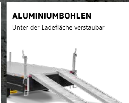
ALUMINIUMBOHLEN Unter der Ladefläche verstaubar