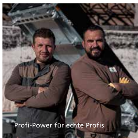
Profi-Power für echte Profis