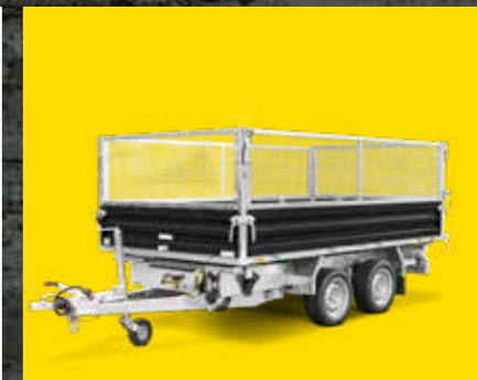
STAHLGITTERAUFSATZ Perfekt für Garten- und Landschaftsbau