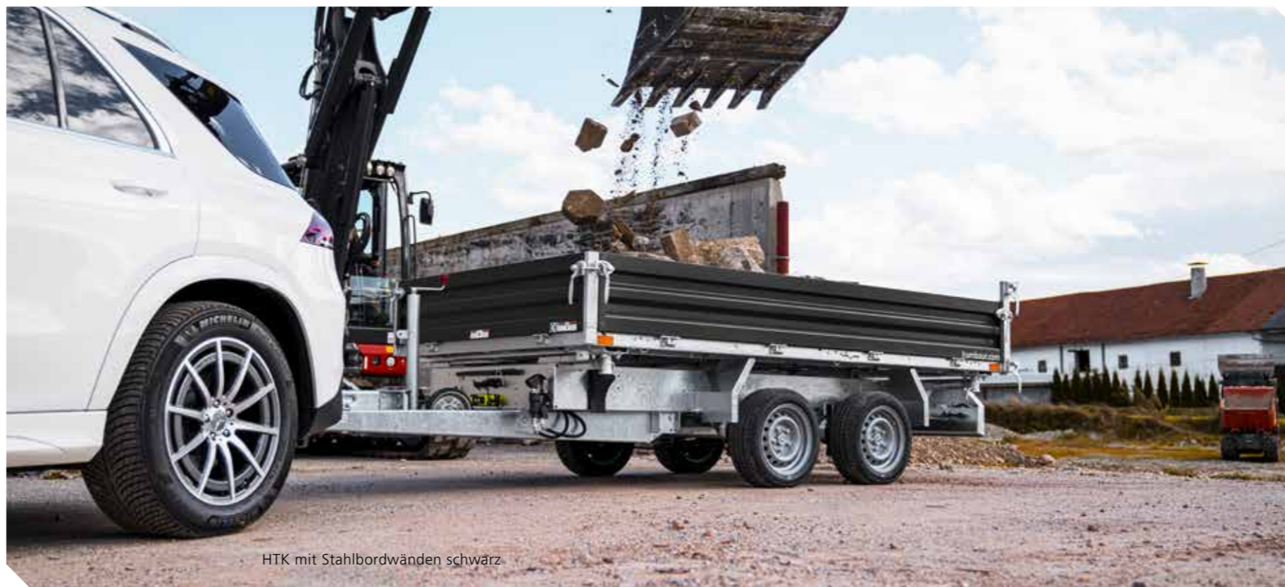
HTK mit Stahlbordwänden schwarz