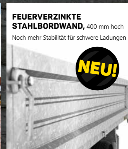
FEUERVERZINKTE STAHLBORDWAND, 400 mm hoch Noch mehr Stabilität für schwere Ladungen