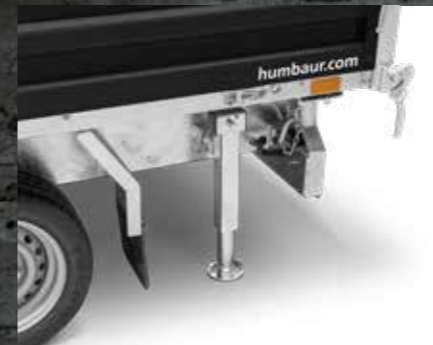
TELESKOP-KURBELSTÜTZEN Optimale Standfestigkeit, abklappbar