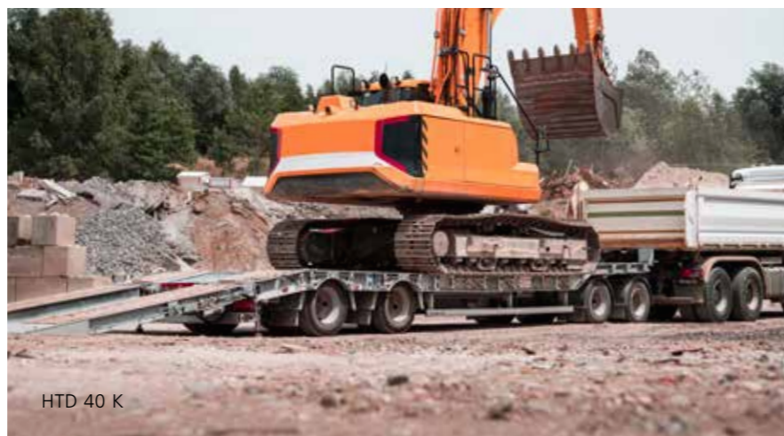
HTD 40 K