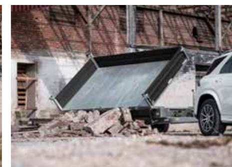
Der HTK kann mit wenigen Handgriffen rückwärts und seitlich abkippen.