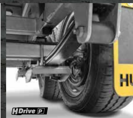
PARABELFEDER Geringer Federweg, maximaler Komfort