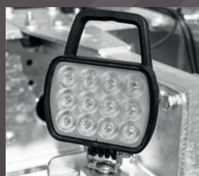
Zusätzlicher LED Arbeitsscheinwerfer