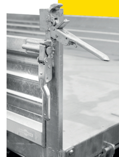
Durchdachte Funktionalität bis ins Detail