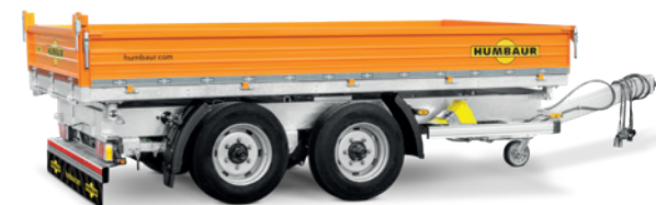
HTK 7,5T mit lackierten Bordwänden

Technische Änderungen vorbehalten. Alle Maßangaben sind Circa-Werte und beziehen sich auf das Serienfahrzeug ohne Zubehör. Zusatzausstattung verändert das Eigengewicht und die Nutzlast!