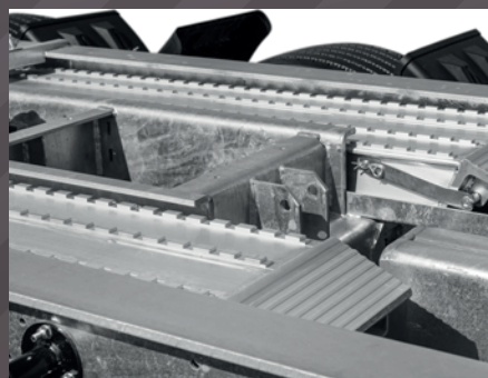
Aluminium Auffahrampen mit patentierter Verriegelung