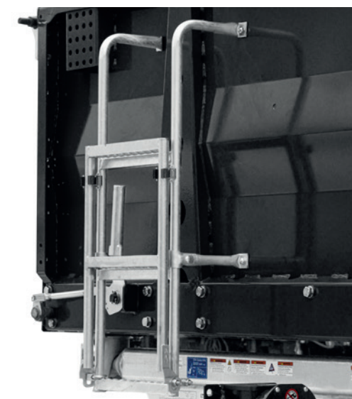
Aufstiegsleiter an Stirnwand