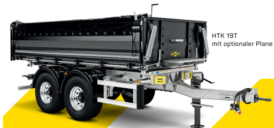
HTK 19T mit optionaler Plane

Mit einem zulässigen Gesamtgewicht von 19 Tonnen eignet sich der HTK 19t nicht nur für Schüttgüter wie Erde, Sand und Kies, sondern auch für Baumaterialien, wie Ziegelsteine und Betonquader. Auf Palettenbreite konstruiert erlaubt der Tandem-Dreiseitenkipper zudem den sicheren Transport von Palettenware. Seine optimalen Fahr- und Kippeigenschaften machen ihn zudem zu einem unverzichtbaren Helfer gerade bei heavy duty Einsätzen – und das bei einem verhältnismäßig geringen Eigengewicht. Serienmäßig ist die Kipperbrücke mit einer KTL-Beschichtung und Lackierung versehen.