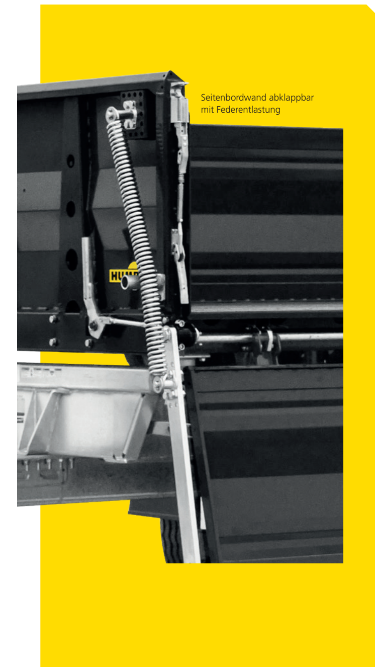
Seitenbordwand abklappbar mit Federentlastung