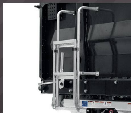
Aufstiegsleiter an Stirnwand