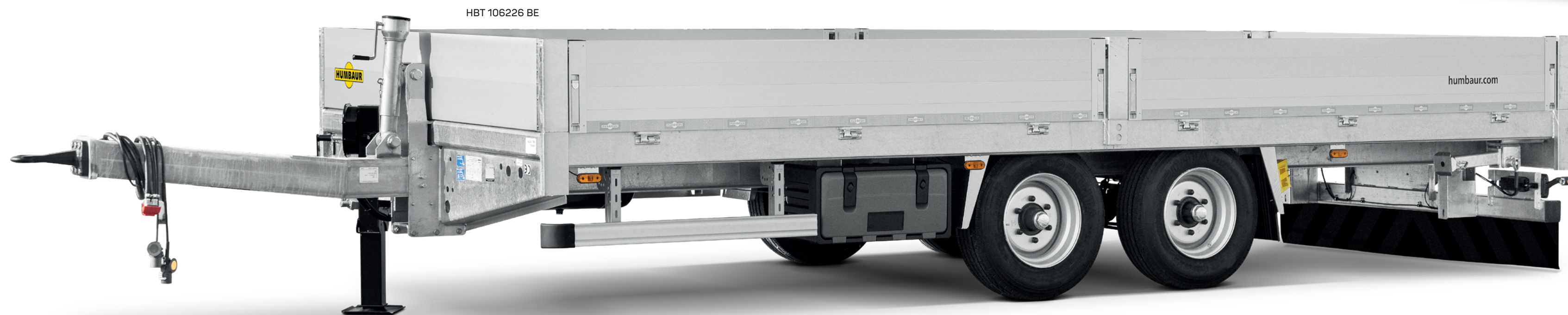
HBT 106226 BE