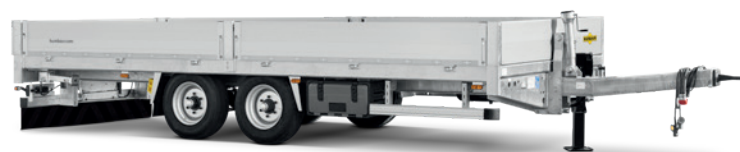
HBT 106226 BE