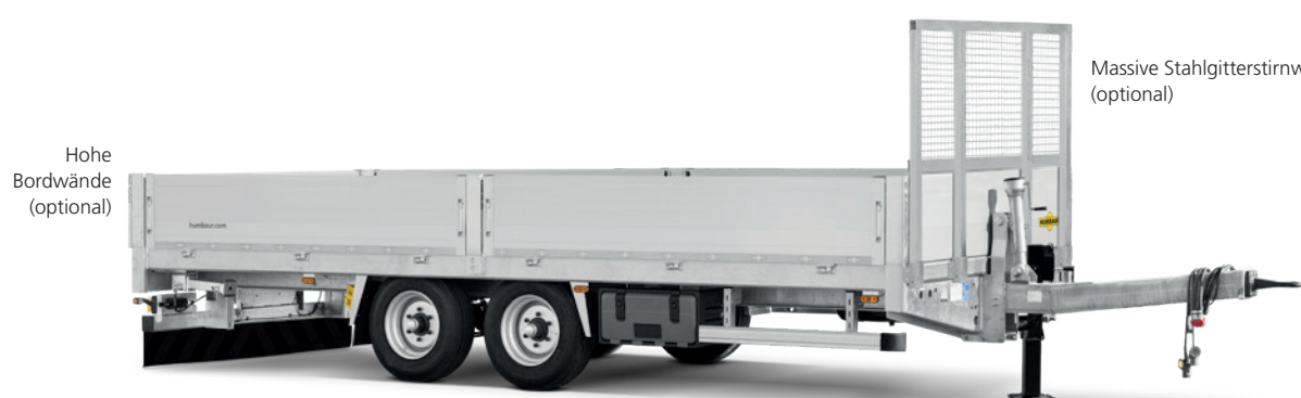
Hohe Bordwände (optional)