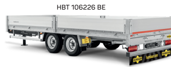
HBT 106226 BE