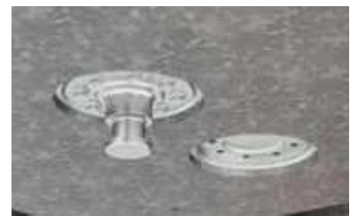
2 Positionen für Königszapfen

*Sicherheitshinweis! Die Verwendung der Anhänger darf nur unter ausdrücklicher Beachtung aller straßenverkehrsrechtlichen, berufsgenossenschaftlichen und ladungssicherungstechnischen Vorschriften erfolgen. Alle Angaben ohne Gewähr! Für Irrtümer und Druckfehler wird keine Haftung übernommen. Technische Änderungen vorbehalten. Alle Maßangaben sind ca. Werte und beziehen sich auf das Serienfahrzeug ohne Zubehör. Zusatzausstattung verändert das Eigengewicht und die Nutzlast. Abbildungen ähnlich, können aufpreispflichtiges Zubehör enthalten.