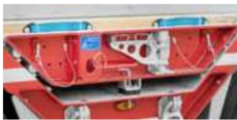
Radmulden mit ausziehbaren Abdeckungen und Holzbelag