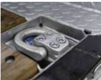
Versenkte 10 t Zurrpunkte